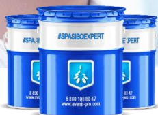
#DGENERX Полимерные материалы