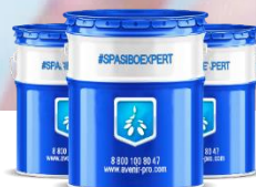
#MILERID Модификаторы полимер