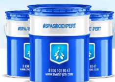
#ZULSER Сырьевые компоненты