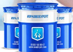
#LIGBERIT Сырьевые добавки