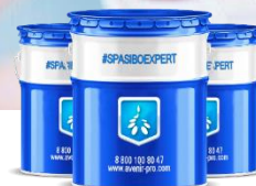
#SQUAD Системы полимер

Мы создаем полимерную химию специального назначения. Мы даем возможность нашим клиентам удовлетворять текущие и возникающие задачи их потребителей из всех отраслей во всем мире. В своей работе мы объединяем экономический успех с деятельностью по защите окружающей среды и социальной ответственностью перед всем обществом. Мы работаем с той степенью надежности и личной ответственности, какую может обеспечить только компания, управляемая владельцем, но при этом с навыками и опытом международной компании.